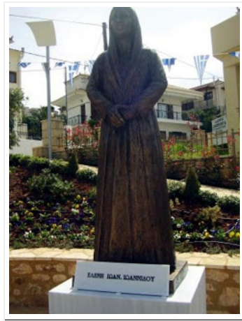
Το άγαλμα της Έλένης Ιωαννίδου στην Κυπαρισσία